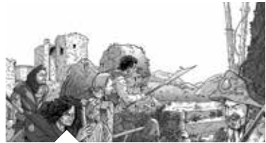
FRANÇOIS VILLON Théâtre - page 8