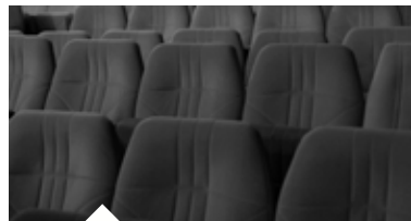
INFORMATIONS COMPLÉMENTAIRES Pass' région, contact - page 15