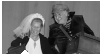
L'ASSOMMOIR Théâtre - page 11