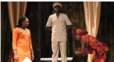
ANTIGONE I MA KOU Théâtre international - page 10