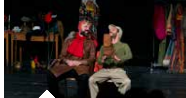
LA LISA S'EN COSTUME Improvisation - page 5