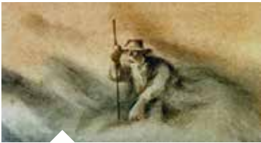
L'HOMME QUI PLANTAIT DES ARBRES Spectacle musical - page 6