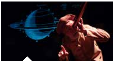
NOTRE TERRE QUI ÊTES AUX CIEUX Théâtre et astronomie - page 12